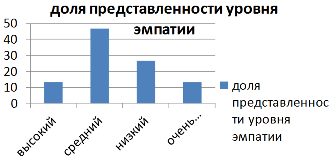
Рис. 1. Доля представленности уровней эмпатии у учителей без учета контингента обучающихся

По доле представленности уровней эмпатии построен профиль (рис.1)