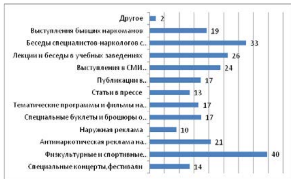
Диаграмма 3. Мнение респондентов о наиболее эффективных мероприятиях для профилактики наркомании, (в %).

Наиболее эффективными мероприятиями для профилактики наркомании респонденты считают проведение «физкультурных и спортивных мероприятий» (40%), «беседы специалистов наркологов с родителями учащихся, студентов» (33%), «лекции беседы в учебных заведениях» (26%) (диаграмма 3).