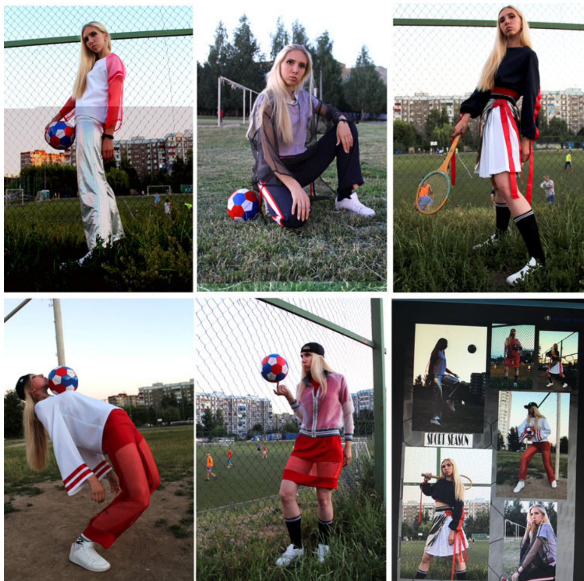
Коллекция, выполненная по мотивам творчества А. Дейнеки.

Концепция создания такой коллекции базируется на комфорте, удобстве, свободе, лёгкости, современности и, конечно же, на спорте, позволяет совмещать в себе вещи из разных ассортиментных групп, направлений, тенденций, материалов. Данная коллекция предоставляет варианты ношения брюк в спортивном стиле и легкую прозрачную накидку, романтического платья и спортивных огромных кед, а также миксы разных материалов, органза и спандекс, габардин и парча. Целостность образа достигается введением различных аксессуаров (бандан, кепок, кед, принтованных носков). Коллекция представляет модели удобной одежды, которая не сковывает движения и подходит для активного досуга.